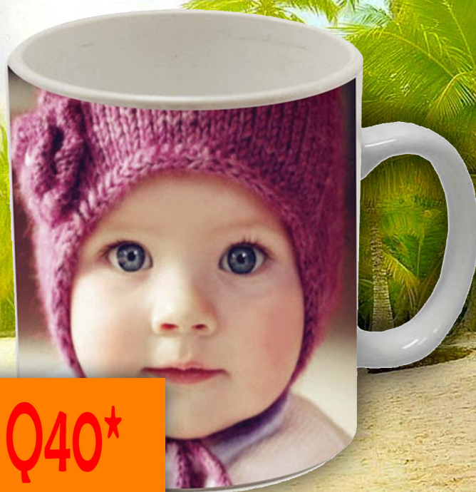
TAZA SUBLIMADA Q40*

*De 3 tazas en adelante, precio por unidad Q50